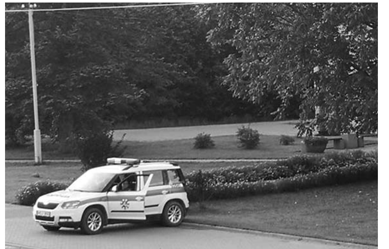
Policija gauna daug įvairiausių iškviėtimų, kurie su jų darbu neturi nieko bendra.

Anykščių policijos komisariatas paviėšino, kaip kai kurie piliečiai pasiaiškina policijos pareigūnams.