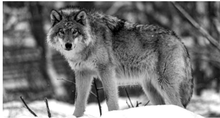
Vilkai papjovė dvi avis ir tris ėriukus.